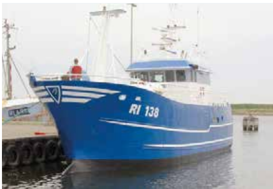
Model "Hvide Sande" er på prøve på RI 138 HELLE JES