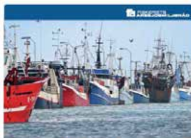
GODE RÅD TIL SKIPPER OG BESÆTNING PÅ FARTØJER, DER ANVENDES TIL INDUSTRIFISKERI

Inden opstarten af industrifiskesæsonen gennemførtes kampagnen "Gode råd til skipper og besætning på fartøjer der fanger industrifisk".